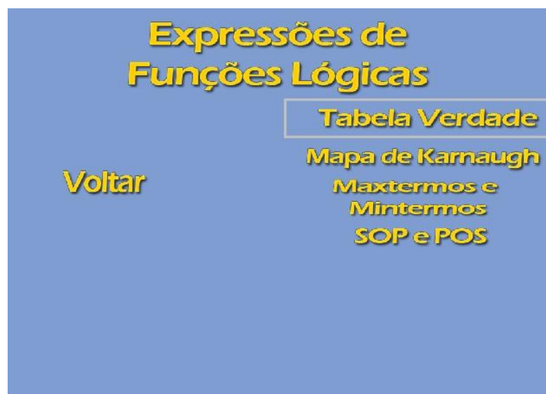
Figura 2 – Menu de tipos de expressões.

Optando-se por “Tipos de expressões”, é apresentado um submenu para essa opção, como é ilustrado na Figura 2. A subdivisão é feita segundo as formas pelas quais uma função lógica pode ser representada. O conteúdo de cada item descreve as principais características da forma de expressão escolhida.